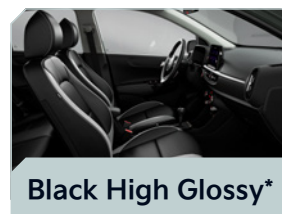
Black High Glossy*