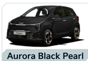
Aurora Black Pearl