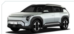
Ivory silver Matte*