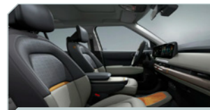
Light Warm Grey*