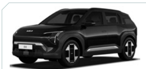
Aurora black pearl